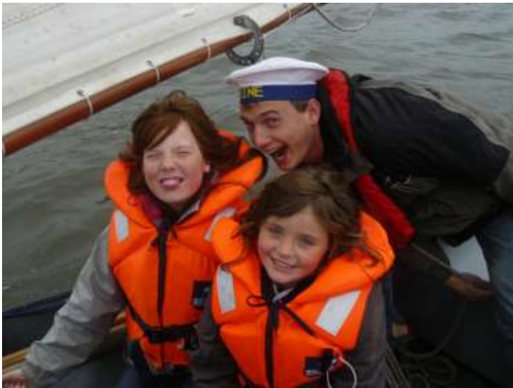
Gelukkig gaan plezier en veiligheid goed samen

Mocht het fout gaan dan kan een reddingsvest jouw leven redden. Om zeker te weten dat alle orka's over een goed reddingsvest beschikken maken wij gebruik van één vast type. Elke keer als je in een vlet of kano stapt zorg je dat je een reddingsvest bij je hebt. Wij zorgen dat er altijd een goed reddingsvest voor je aanwezig is.