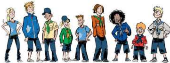
De uniformen binnen Scouting Nederland

Voor de blauwe uniformblouse moet je zelf zorgen. Je kunt deze overnemen van een andere orka of bij de Scoutshop. Het adres vind je achterin in dit boekje. De leiding zorgt voor een groepsdas en de insignes. Samen kost dit €15,-. We adviseren de dasring aan de groepsdas te naaien zodat je hem minder snel kwijt raakt. Mocht je hem toch per ongeluk kwijt raken dan kan je bij de leiding een nieuwe kopen.